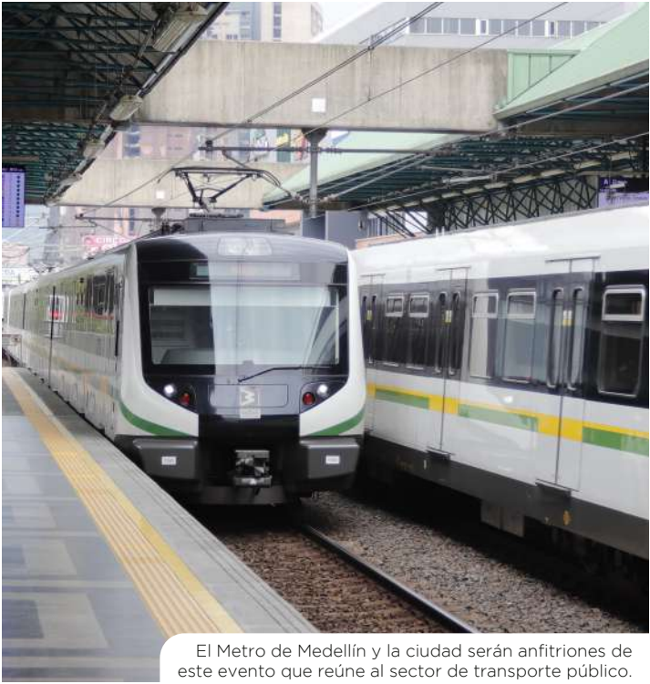
El Metro de Medellín y la ciudad serán anfitriones de este evento que reúne al sector de transporte público.