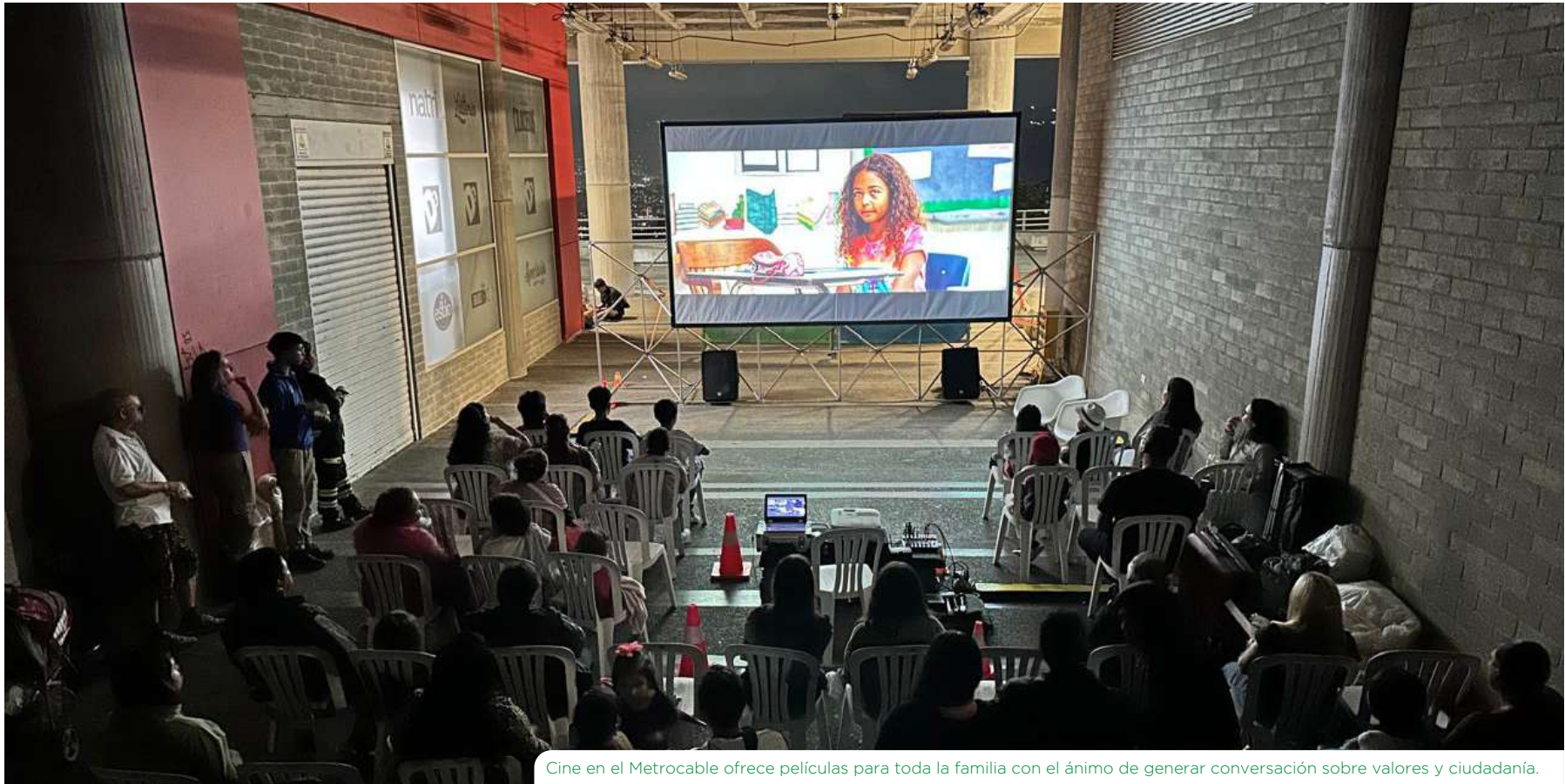
Cine en el Metrocable ofrece películas para toda la familia con el ánimo de generar conversación sobre valores y ciudadanía.

Niñas y niños vecinos de la línea J disfrutaron hace poco de una noche de cine y crispetas en la plazoleta de la estación La Aurora.