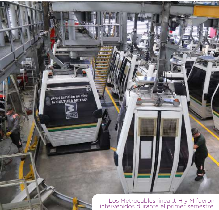
Los Metrocables línea J, H y M fueron intervenidos durante el primer semestre.

Cada año, nuestros seis cables aéreos tienen una pausa programada en la operación comercial para recibir su mantenimiento mayor anual, una revisión profunda que garantiza que todo funcione al 100 % y con la seguridad de siempre.