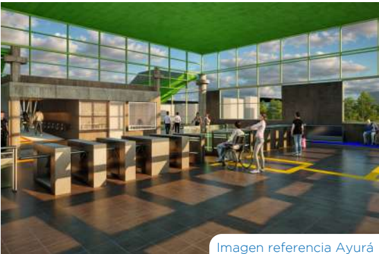
Imagen referencia Ayurá