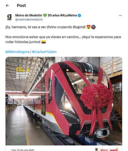
7:42 a. m. - 24 jun. 2025 - 830,5 mil Visualizaciones

Más allá de las cifras, lo destacable de la interacción fue la camaradería que se expresó en dos mensajes cargados de alegría compartida, empatía, respeto y el deseo de sumar esfuerzos para que muy pronto Bogotá tenga su metro y nuestro sistema esté ahí, acompañando, para que el camino inicie de la mejor forma.