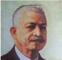
Parada Alejandro Echavarría (Línea T)