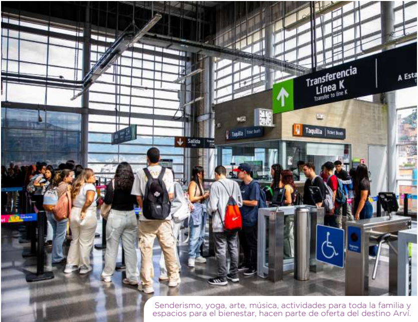
Senderismo, yoga, arte, música, actividades para toda la familia y espacios para el bienestar, hacen parte de oferta del destino Arví.

Si estás en las categorías A o B de Comfama (ingresos hasta 4 salarios mínimos), puedes disfrutar del Metrocable turístico de Arví por solo $3.500. Solo necesitas presentar tu cédula en los puntos de venta de la Red Metro. Si eres categoría C, la tarifa es de $10.950.