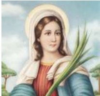
Estación Santa Lucía (Línea B)