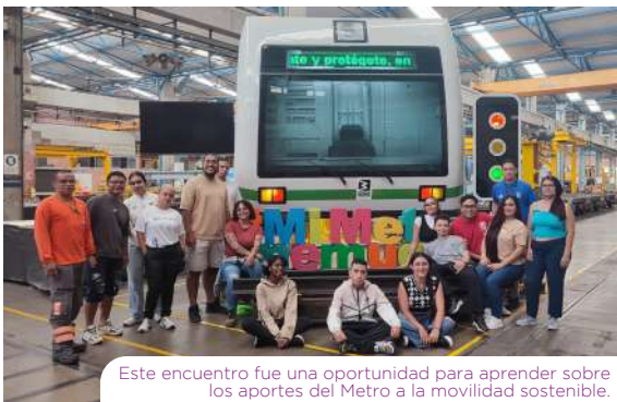
Este encuentro fue una oportunidad para aprender sobre los aportes del Metro a la movilidad sostenible.