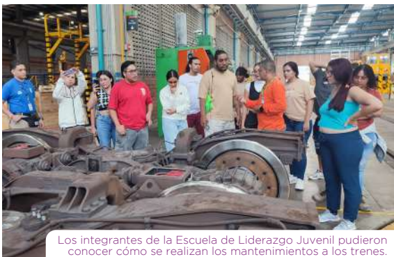
Los integrantes de la Escuela de Liderazgo Juvenil pudieron conocer cómo se realizan los mantenimientos a los trenes.

Uno de los módulos de formación está dedicado al relacionamiento positivo con el entorno: Biodiversidad, inclusión, cambio climático y movilidad sostenible. Para esto, los integrantes de la Escuela tuvieron un recorrido guiado por los talleres Metro para descubrir más de cerca cómo funciona nuestro sistema de transporte, las rutinas de mantenimiento preventivo, los avances de la industria local que facilitaron la modernización de los trenes de primera generación