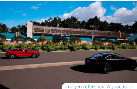
Imagen referencia Aguacatala