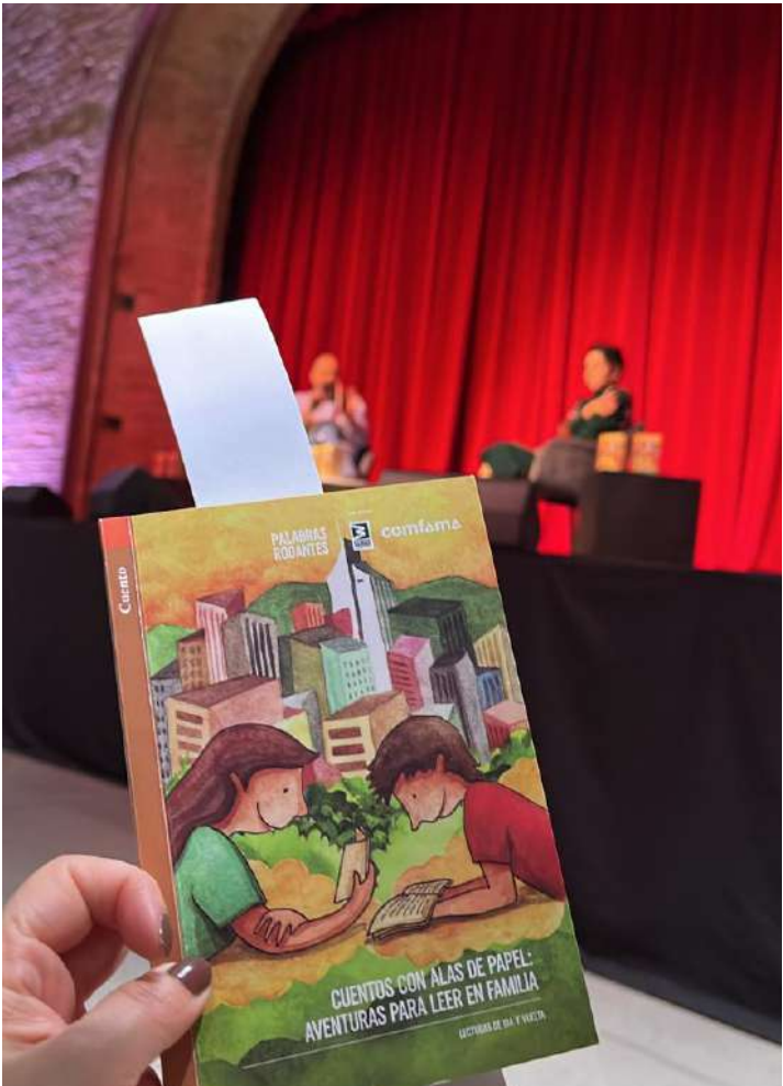
Los niños se emocionaron con la presentación de Jabrú, teatro de títeres.

También tuvimos una presentación especial de Jabrú, teatro de títeres, que mostró fragmentos de la obra Navegantes de papel , en la que los niños, niñas y adultos asistentes, acompañaron la obra agitando alitas de papel. Palabras Rodantes es una estrategia de promoción de lectura que tiene como aliados al Metro y a Comfama.