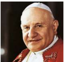
Estación Juan XXIII (Línea J)

Ignacio de Loyola (1491) fundó la Compañía de Jesús. Pidió a los jesuitas enseñar la Biblia en las aulas, pero también literatura y clásicos. E instó a sus misioneros a escribir sobre costumbres, vegetación y vida silvestre, que buscaran a Dios en todo.