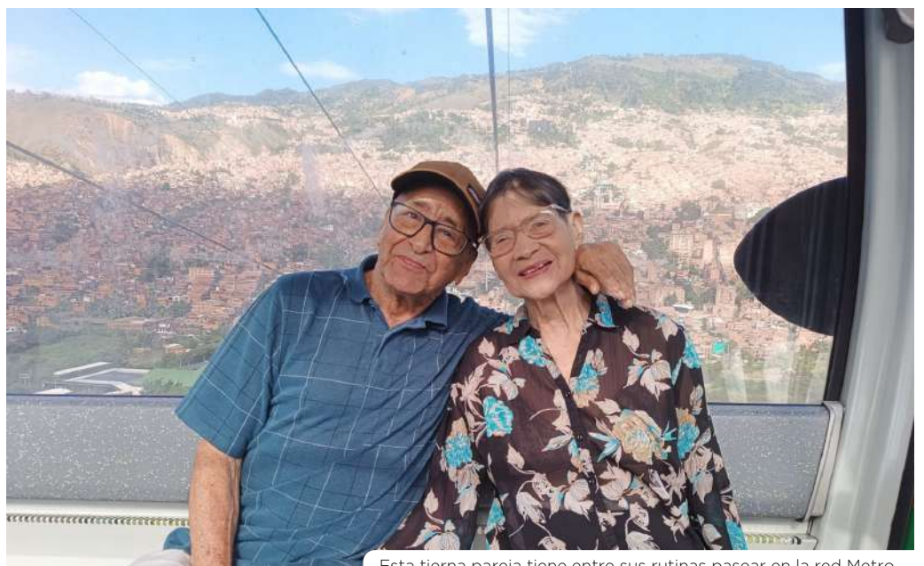
Esta tierna pareja tiene entre sus rutinas pasear en la red Metro.

Ellos son prueba de la belleza inesperada, esa que nos recuerda que, incluso en los días más comunes, nuestros viajeros nos sorprenden con sus historias y nos mueven el corazón. ¿Y tú también sales a “ventearte” en el Metro? Si es así, cuéntanos en nuestras redes sociales (@metrodemedellin) cuál es tu recorrido favorito.