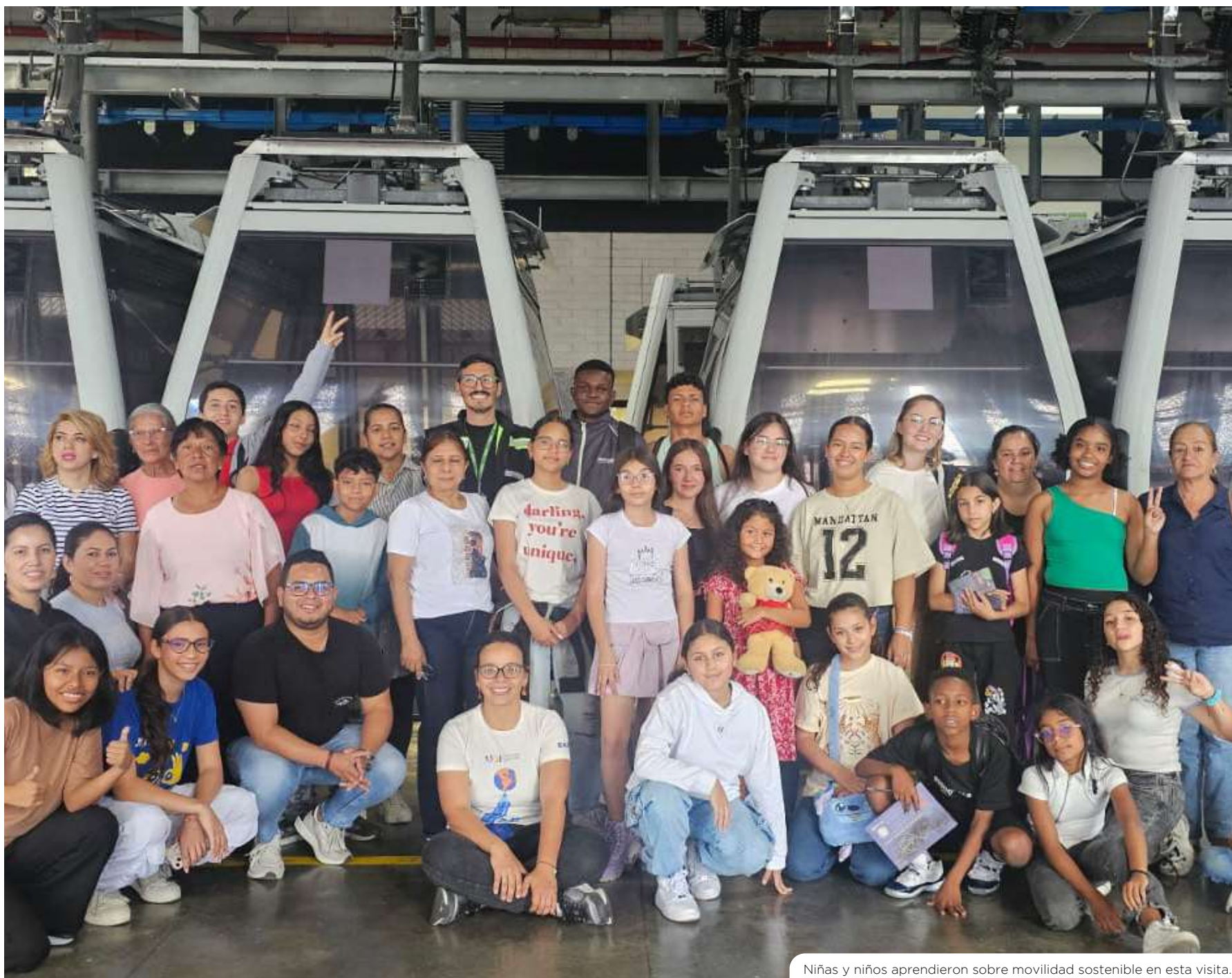
Niñas y niños aprendieron sobre movilidad sostenible en esta visita.

Recientemente realizamos varias actividades que contaron con la participación de niños y niñas de diferentes lugares del área Metropolitana, quienes tuvieron la oportunidad de aprender, compartir y conectarse con la ciudad. Experiencias que se viven A lo Metro.