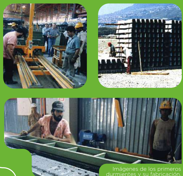
Imágenes de los primeros durmientes y su fabricación.

En la planta de durmientes de Bello se fabricaron las unidades requeridas para las mencionadas líneas; luego, para la extensión al sur y la ampliación de los patios, se empezaron a adquirir en una empresa colombiana con sede en Santa Marta.