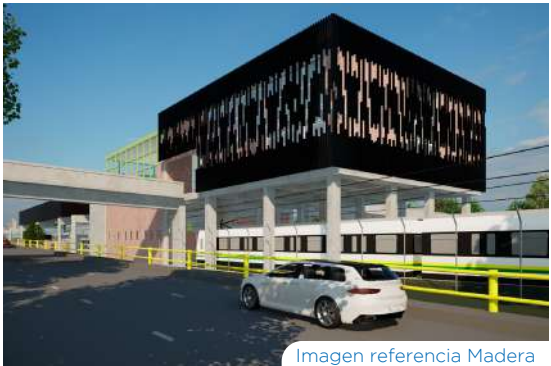
Imagen referencia Madera