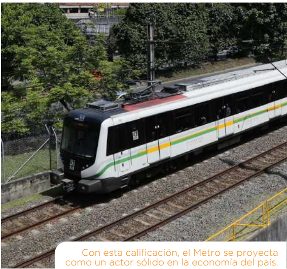
Con esta calificación, el Metro se proyecta como un actor sólido en la economía del país.

Las calificaciones nacionales ‘F1’ indican la más fuerte capacidad de pago oportuno de los compromisos financieros en relación con otros emisores u obligaciones en el mismo país. En la escala de calificación nacional de Fitch, esta calificación es asignada al más bajo riesgo de incumplimiento en relación con otros en el mismo país. Cuando el perfil de liquidez es muy fuerte, se añade un “+” a la calificación asignada.