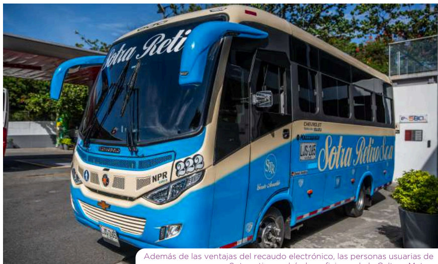
Además de las ventajas del recaudo electrónico, las personas usuarias de Sotraretiro podrán beneficiarse de la Cultura Metro.