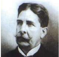
Cisneros (Estación en línea B y parada en línea 1)

Deben su nombre al ingeniero cubano- norteamericano, Francisco Javier Cisneros, quien llegó a Antioquia en 1874, a la edad de 38 años, para encargarse de la construcción del Ferrocarril de Antioquia.