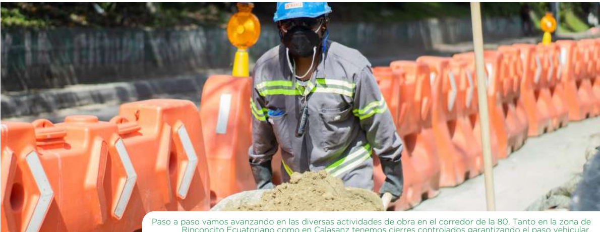
Paso a paso vamos avanzando en las diversas actividades de obra en el corredor de la 80. Tanto en la zona de Rinconcito Ecuatoriano como en Calasanz tenemos cierres controlados garantizando el paso vehicular.

Estamos preparando el terreno para un nuevo sistema de transporte. Actualmente esta actividad la desarrollamos principalmente en el barrio Córdoba, San Germán y recientemente en Belén y en el sector de Los Pinos. Sumamos: 87 predios demolidos 159 predios de compra parcial desmontados