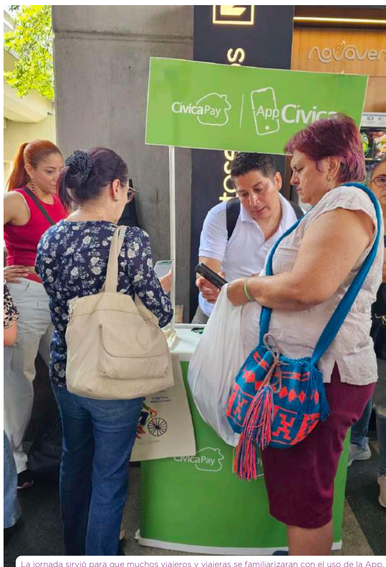
La jornada sirvió para que muchos viajeros y viajeras se familiarizaran con el uso de la App.

Así vivimos una Feria con más conexión, más movilidad y usuarios felices viajando con App Cívica.