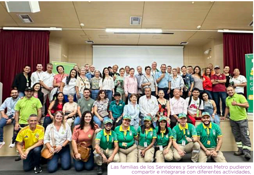
Las familias de los Servidores y Servidoras Metro pudieron compartir e integrarse con diferentes actividades,

Fueron jornadas llenas de emoción, en las que la Empresa demostró a las familias lo importantes que son, porque detrás de cada persona que hace parte del Metro de Medellín, hay hijos, hijas, esposos, esposas, nietos, nietas y demás familiares, que también son parte de la Gente Metro.