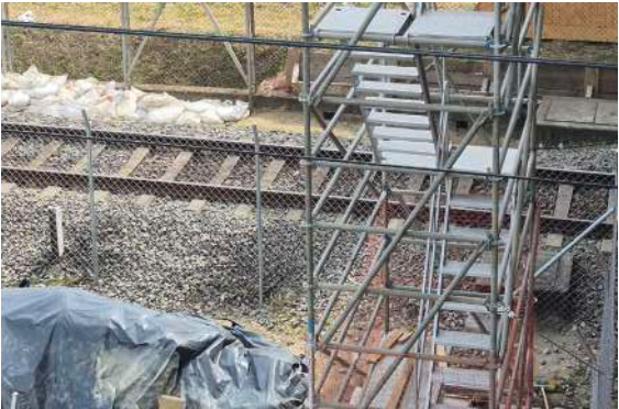
En la actualidad se trabaja en la instalación de los ascensores. El proyecto contempla 27.