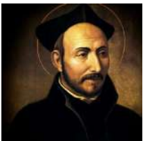
Parada Loyola (Línea T)

Santa Lucía nació en Siracusa (Italia) en el año 281, en una familia acomodada. Su entrega a Dios hizo que se negara a casarse con un joven que la acusó de ser cristiana, religión prohibida en esa época. Por eso fue enjuiciada y decapitada.