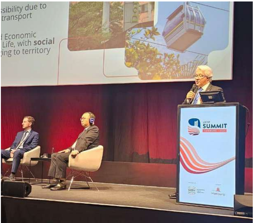
Son varios los espacios académicos y técnicos en los que el Metro ha podido compartir sus experiencias y conocimiento en los últimos meses.

En los últimos meses, nuestra Empresa ha participado en varios eventos académicos y técnicos relacionados con movilidad, infraestructura y gobierno corporativo. En ellos, además de compartir nuestro conocimiento, nos enriquecemos con las ideas de otras organizaciones, lo que nos permite prestar un mejor servicio.