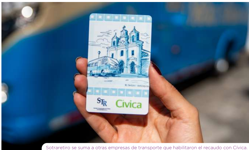
Sotraretiro se suma a otras empresas de transporte que habilitaron el recaudo con Cívica.

Adicional a esto, la expansión del sistema de recaudo electrónico le permite al Metro fortalecer sus ingresos no tarifarios y continuar promoviendo la Cultura Metro en otros destinos, contribuyendo a una movilidad más integrada, segura y sostenible.