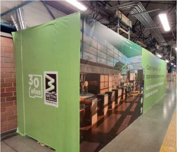
Los cerramientos en las plataformas corresponden a los ascensores. Se recomienda transitar con precaución.

La inversión en este proyecto supera los $61.000 millones y se espera que las obras finalicen en el primer semestre de 2026. La Empresa tiene contemplado iniciar una segunda fase, que abarcará otras estaciones, a mediados del año entrante. Con estas intervenciones se busca facilitar el acceso a la red Metro por parte de todas las personas, generando mayor inclusión y calidad de vida.