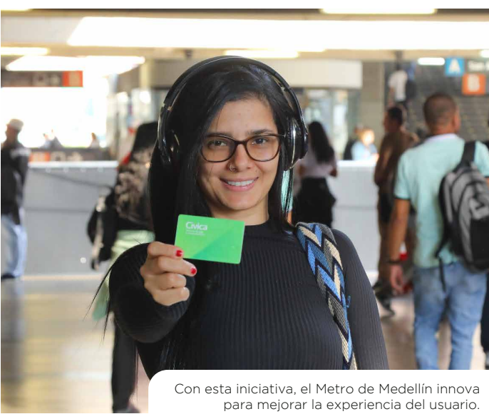
Con esta iniciativa, el Metro de Medellín innova para mejorar la experiencia del usuario.

La alianza estará en funcionamiento durante el tiempo acordado por ambas empresas.