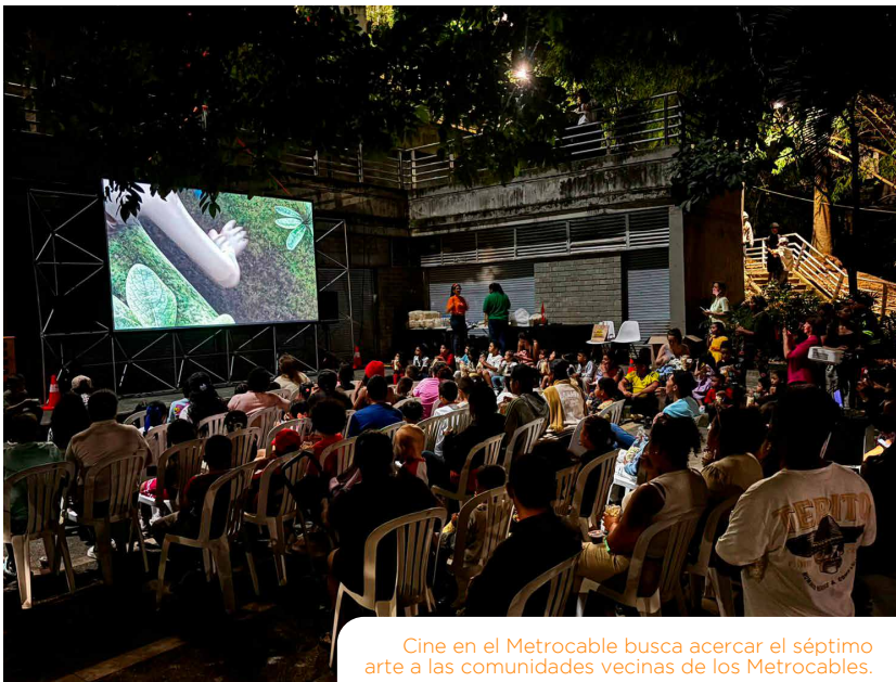
Cine en el Metrocable busca acercar el séptimo arte a las comunidades vecinas de los Metrocables.

Más de 1800 personas que asistieron a nuestras plazoletas para ver las proyecciones de Cine en el Metrocable durante el año 2025. Este proyecto fue posible gracias a la articulación entre Metro de Medellín, La Cinemateca Distrital, Pan Corporación social y la empresa privada Solvo. Este programa también facilitó una serie de conversatorios con invitados y expertos que articulaban las diferentes temáticas de las películas con todos sus campos de estudio: diversidad, discapacidad, niñez y cuidado del medio ambiente. En algunas funciones contamos con la presencia de personajes e invitados especiales: el director Víctor Gaviria, los Festivales Miradas y Fantasmagoría, la red de Enfermedades Huérfanas, y el consulado de Perú. Gracias a este programa, familias vecinas del Sistema pudieron disfrutar de buenas películas de manera gratuita y tuvieron un espacio de entretenimiento y reflexión en torno al séptimo arte.