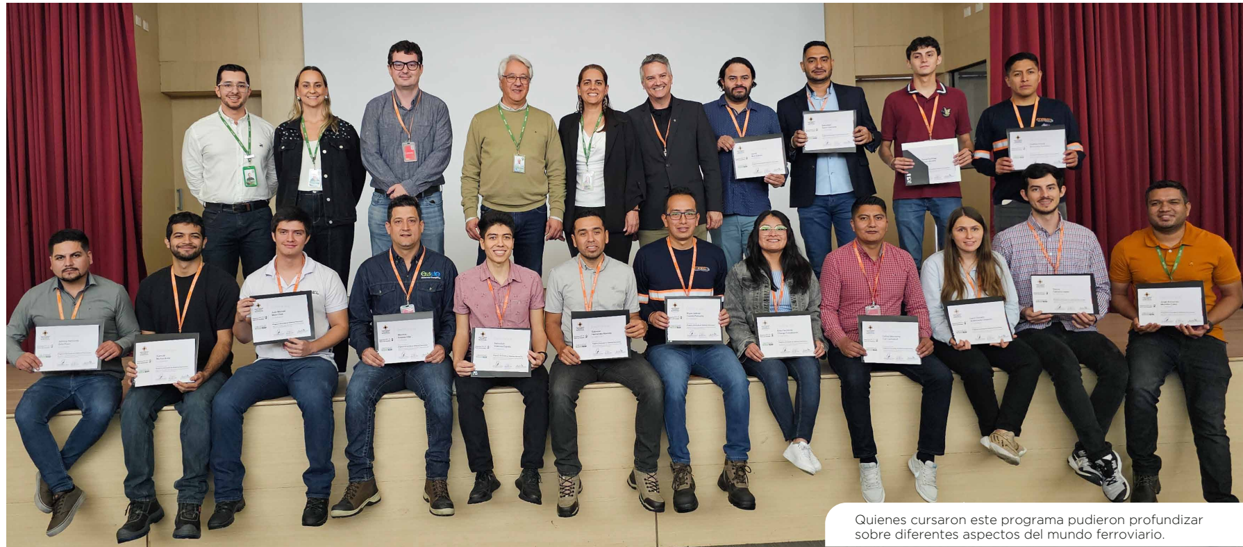
Quienes cursaron este programa pudieron profundizar sobre diferentes aspectos del mundo ferroviario.

Durante el programa los estudiantes aprendieron sobre ferrocarriles de carga y pasajeros, superestructura y vía, esquemas de operación de ferrocarriles, electrificación ferroviaria, señalización, formulación y gestión de proyectos ferroviarios, normatividad de los proyectos ferroviarios, entre muchos otros.