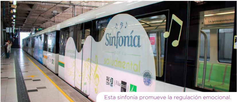
Esta sinfonía promueve la regulación emocional.

Este sueño colectivo ha sido posible gracias a la confianza de la ciudadanía y a una visión de futuro que se consolidó en nuestro Plan Maestro “Confianza en el Futuro”, articulado con la planeación territorial de Medellín y Antioquia. Cada viaje es una historia que conecta barrios, familias y oportunidades, y nos recuerda que el Metro es mucho más que transporte: es cultura, sostenibilidad y calidad de vida.