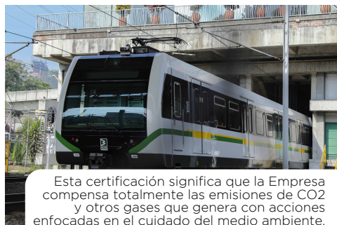
Esta certificación significa que la Empresa compensa totalmente las emisiones de CO2 y otros gases que genera con acciones enfocadas en el cuidado del medio ambiente.

El Icontec nos certificó como una Empresa carbono neutral gracias a nuestras acciones para reducir las emisiones de gases de efecto invernadero (GEI), reconocimiento que confirma que la Cultura Metro también se respira cuidando el entorno que compartimos.