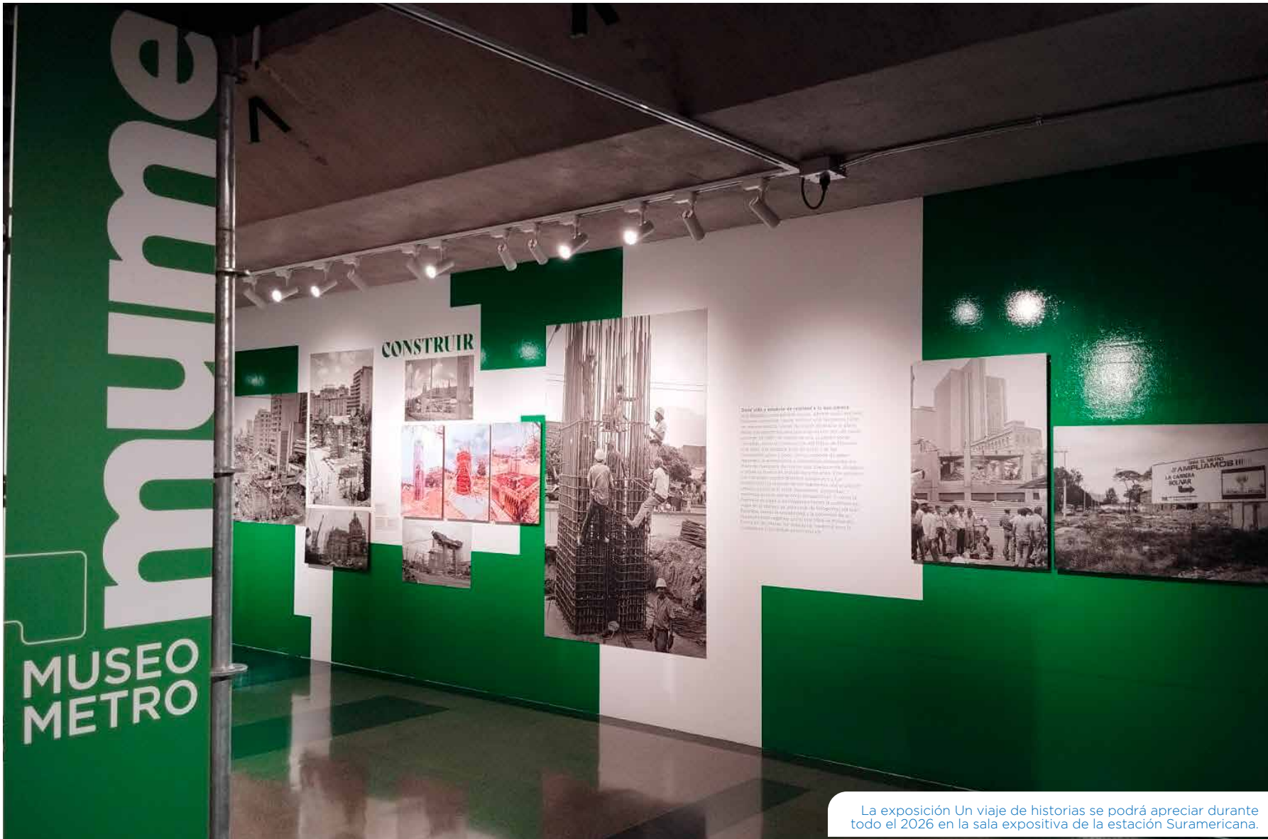
La exposición Un viaje de historias se podrá apreciar durante todo el 2026 en la sala expositiva de la estación Suramericana.