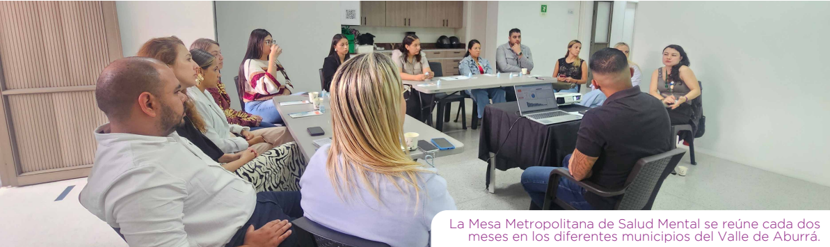
La Mesa Metropolitana de Salud Mental se reúne cada dos meses en los diferentes municipios del Valle de Aburrá.

Como resultado concreto de esta mesa se realizó en septiembre y octubre el Festival de la Salud Mental con 10 actividades en la red Metro; se produjo un entregable para el manejo de las emociones denominado Ruta Interior; se inauguraron dos nuevos Escuchaderos: uno en la estación Oriente con la Alcaldía de Medellín y otro en la estación Envigado con la Alcaldía de Envigado y la Fundación Éxito. Además se generaron otras acciones como audios de respiración en los trenes y eventos de Elige la Calma. A lo anterior se sumó el III Encuentro Académico de Salud Mental que se llevó a cabo el 11 de noviembre. Allí se dieron cita expertos y profesionales de la salud para hablar sobre temas relacionados con la prevención del suicidio y el manejo adecuado de las emociones. A este Encuentro asistieron cerca de 130 personas.