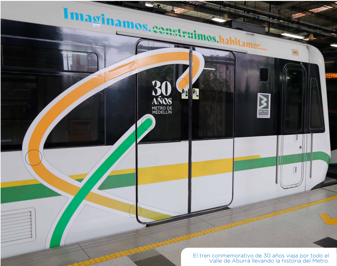
El tren conmemorativo de 30 años viaja por todo el Valle de Aburrá llevando la historia del Metro.

Ambas estrategias se derivan del guion realizado en alianza con la Biblioteca Pública Piloto y es el resultado de un cuidadoso trabajo de investigación.