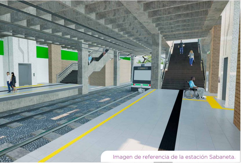
Imagen de referencia de la estación Sabaneta.

manejo adecuado de las emociones y reflexionar, aprender, y sentir como la música puede ayudarnos a regular nuestros estados de ánimo, activar la energía y encontrar serenidad. El tren Sinfonía por tu salud mental ya está rodando por el Valle de Aburrá.