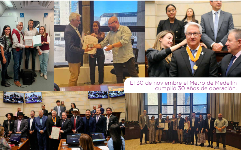
El 30 de noviembre el Metro de Medellín cumplió 30 años de operación.

Con estas acciones, seguimos trabajando por el compromiso de tener una Red Metro más incluyente y accesible, en la que cada persona pueda desplazarse de manera ágil, cómoda y segura, contribuyendo al bienestar y a la calidad de vida de quienes viajan diariamente en el Sistema.