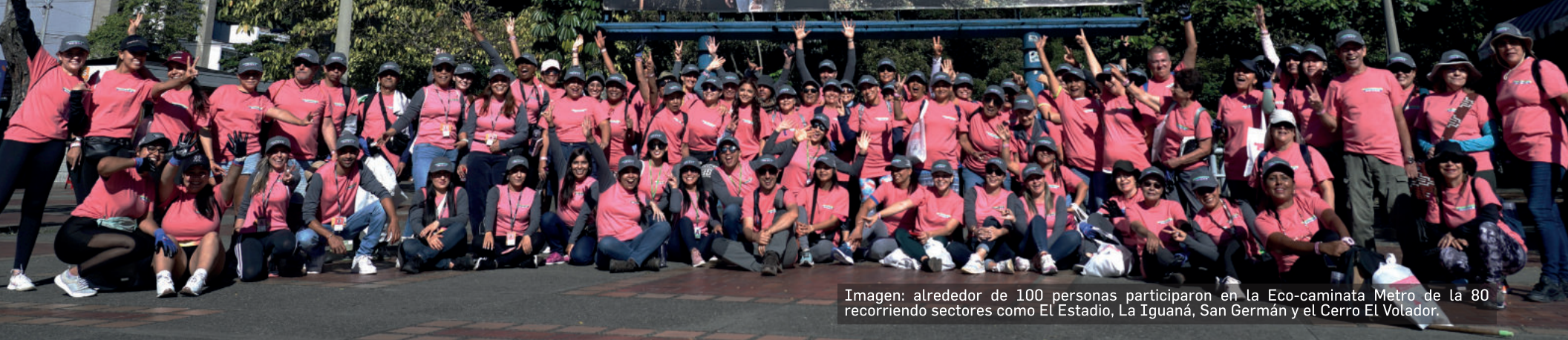
Imagen: alrededor de 100 personas participaron en la Eco-caminata Metro de la 80 recorriendo sectores como El Estadio, La Iguaná, San Germán y el Cerro El Volador.

Tal y como lo habíamos imaginado, nuestra Eco-caminata Metro de la 80 fue todo un éxito. Alrededor de 100 personas de todas las edades y de diferentes sectores de la ciudad, se sumaron a esta iniciativa con la que buscábamos aportar al fortalecimiento de nuestra conciencia ambiental frente al manejo y la disposición