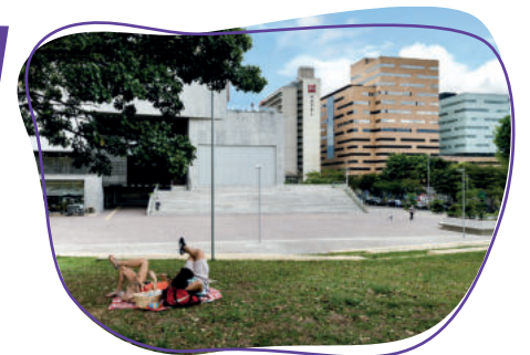
Imagen: foto Ciudad del Río Medellín.

Algunos planes parciales formulados, aprobados y desarrollados en la ciudad, han sido el plan parcial Simesa (Ciudad del Río) y el plan parcial Pajarito (Robledo).