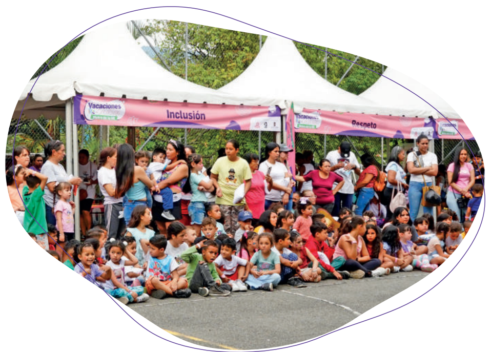
Imagen: vacaciones recreativas comuna 16 Belén