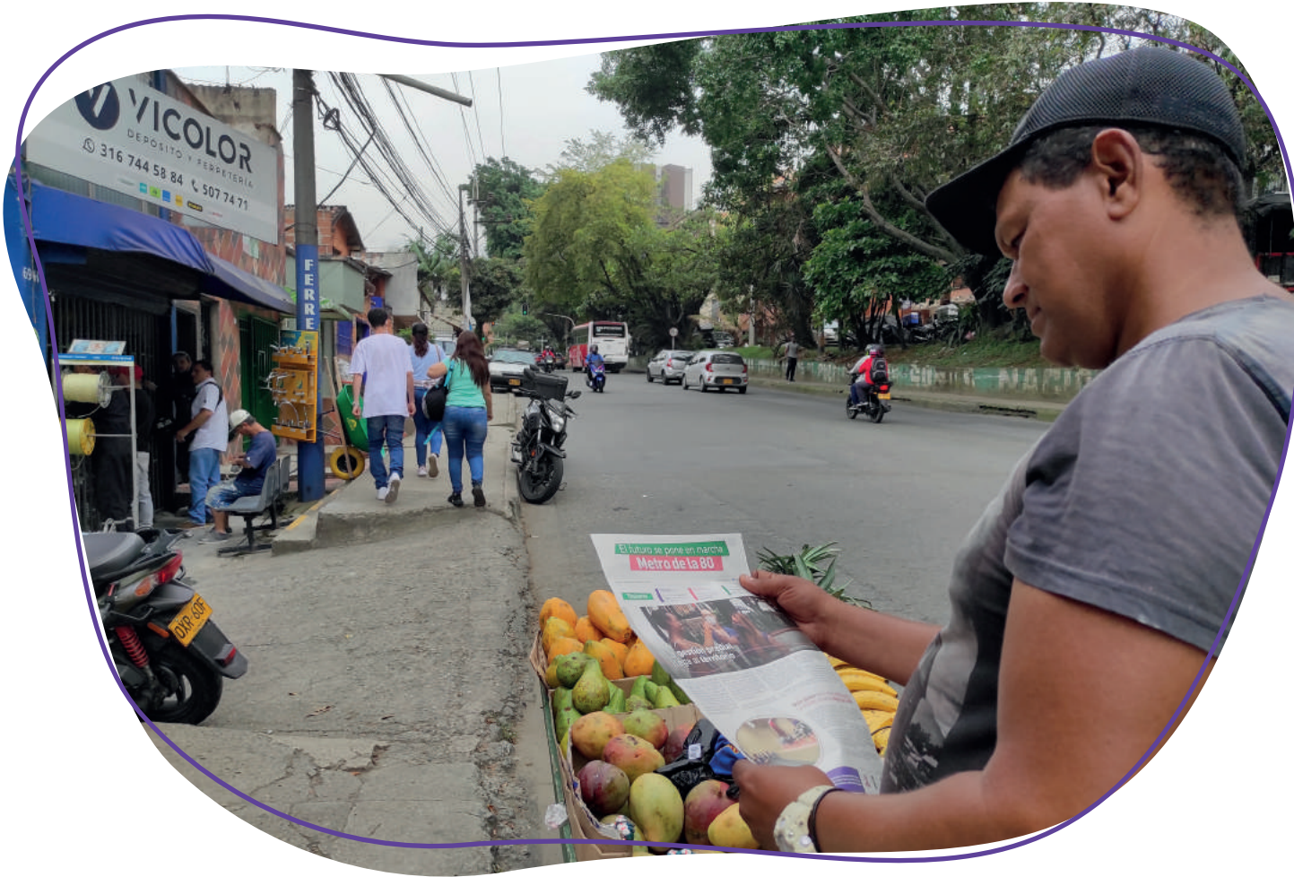
Imagen: en El Volador se cuenta con carteleras barriales y se distribuye la separata para contribuir con la información de todos sus habitantes.