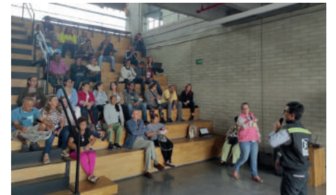
San Germán - Comuna 7