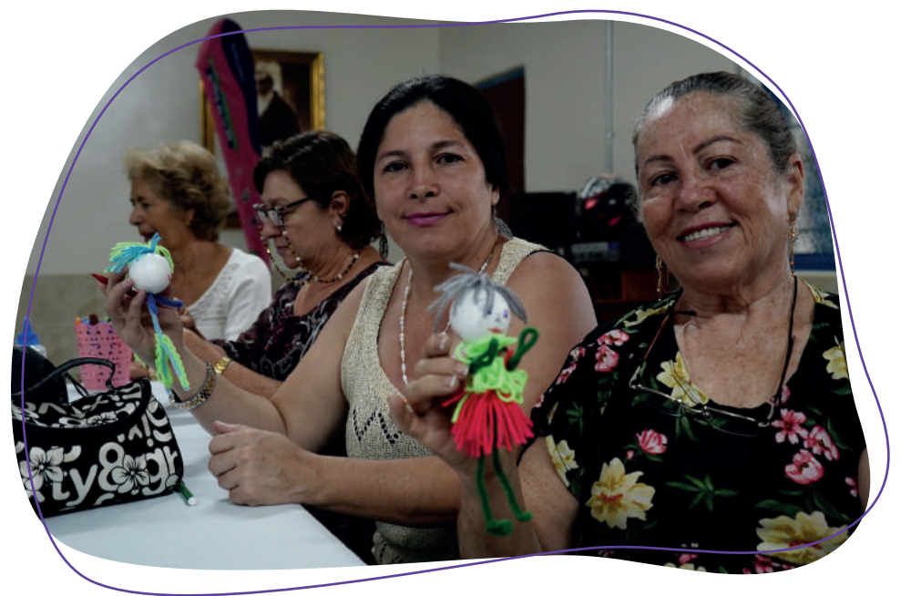
Imagen: grupo de Mujeres Tejedoras de Belén durante taller de primeros auxilios psicológicos.

Es así como el proyecto construye relaciones de confianza con la ciudadanía en general y de manera especial con las comunidades que habitan las áreas de influencia de este corredor de transporte.