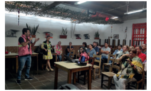
El Volador - Comuna 7