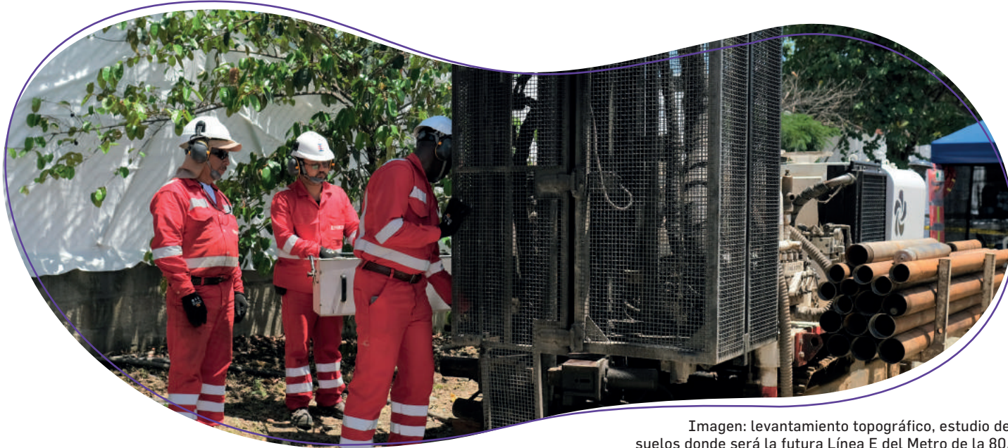
Imagen: levantamiento topográfico, estudio de suelos donde será la futura Línea E del Metro de la 80.

Esta etapa consiste en la realización de las exploraciones geotécnicas con perforaciones en andenes y zonas verdes y con excavaciones, llamadas apiques, en la vía. Igualmente, consiste en la inspección de las redes húmedas como acueducto y alcantarillado y de las redes secas como energía y telecomunicaciones.