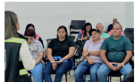
El progreso - Comuna 5

Con el propósito de escuchar las inquietudes de la comunidad y buscar alternativas para solucionarlas, desde la gestión sociopredial del Metro de la 80 y los moradores del territorio, se han propuesto diferentes espacios de escucha y concertación con los actores del proceso, como parte de la Política Pública de Protección a Moradores, Actividades Económicas y Productivas.