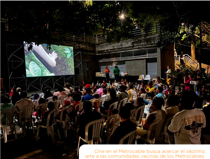
Cine en el Metrocable busca acercar el séptimo arte a las comunidades vecinas de los Metrocables.