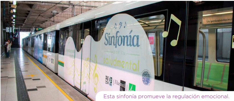
Esta sinfonía promueve la regulación emocional.

Este sueño colectivo ha sido posible gracias a la confianza de la ciudadanía y a una visión de futuro que se consolidó en nuestro Plan Maestro “Confianza en el Futuro”, articulado con la planeación territorial de Medellín y Antioquia. Cada viaje es una historia que conecta barrios, familias y oportunidades, y nos recuerda que el Metro es mucho más que transporte: es cultura, sostenibilidad y calidad de vida.